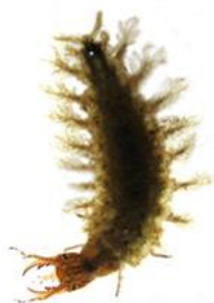
личинка жука- водолюба

Среди представленных животных, выберите тех, у кого и взрослое насекомое, и личинка развиваются в водной среде