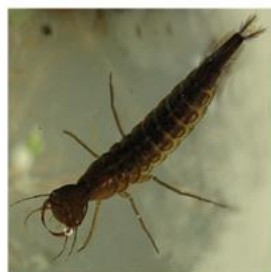
личинка Жука- плавунца